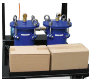
Ersatzpatronen, 2 Stück